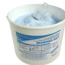
MAMMO-NET Eimer à 10kg mit Dosierbecher

Dichter, gut haftender Schaum dank speziellem FOAM-Becher