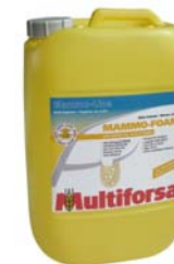
MAMMO-FOAM Kanister à 10kg

Nachfüllpackung: Karton à 2 Feuchttrollen