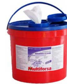
MAMMO-CLEAN Eimer à 1000 Tücher