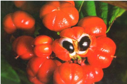
Guarana aus dem brasilianischen Regenwald ist ein altbewährtes Aufputsch- und Stärkungsmittel.

immu-KICK enthält aus Guarana extrahiertes Guarantin. Dieses ist das stärkste natürlich vorkommende Koffein. Wie medizinische Untersuchungen belegen, ist Guarana auch ein ausgezeichnetes Stärkungsmittel. Seine vitalisierende und stimmungsaufhellende Wirkung ist bereits kurz nach der Einnahme spürbar. Zusammen mit dem Koffein der Colanuss und den anderen Wirkstoffen der Colanuss wecken die Pflanzenextrakte im immu-KICK - im wahrsten Sinne des Wortes – die Lebensgeister.