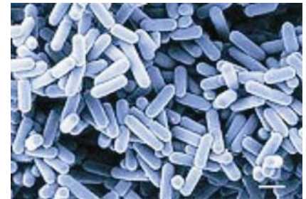
Milchsäurebakterien helfen eine gesunde Besiedelung des Darms sicher zu stellen und die Darmschleimhaut zu schützen.

Nach der Geburt ist der Verdauungskanal absolut steril. Für das Kalb ist es sehr wichtig, dass die Besiedlung des Darms möglichst schnell mit wertvollen Darmbakterien erfolgt, damit Krankheitserreger keinen Platz haben. Milchsäurebakterien stabilisieren die Darmflora und unterstützen die weitere Besiedlung mit wertvollen Darmbakterien. Dadurch kann sich die Darmschleimhaut optimal entwickeln.