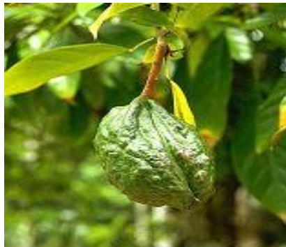
Die Hauptwirkstoffe der Colanuss sind Koffein und Theobromin, Catechin, Epicatechin und Procyanidine. Diese natürlichen Stoffe wirken anregend auf den Organismus und Stoffwechsel.